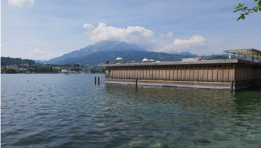
Seebad Luzern