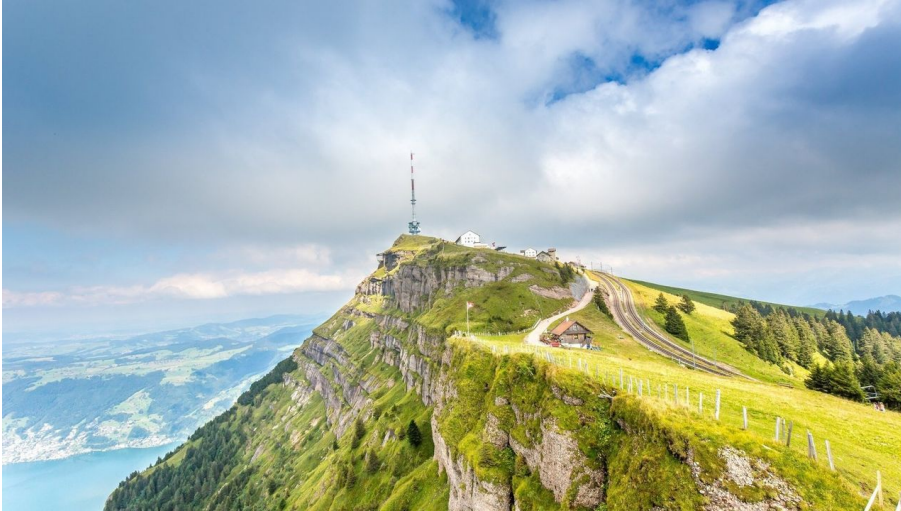
Rita Baggenstos, Schwyzer Wanderwege