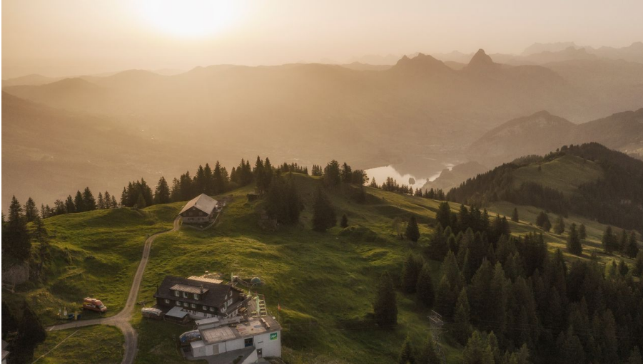
Rigi Burggeist