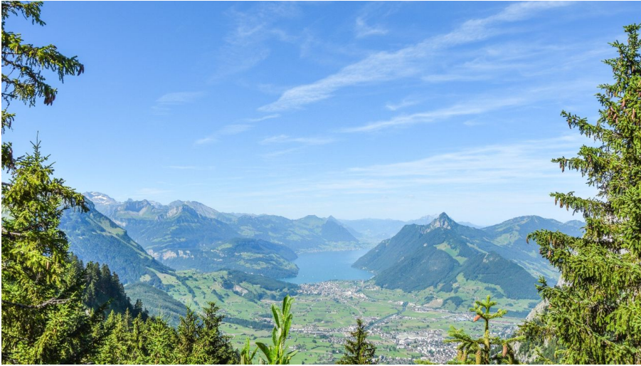
Rundwanderung um die Grosse Mythen