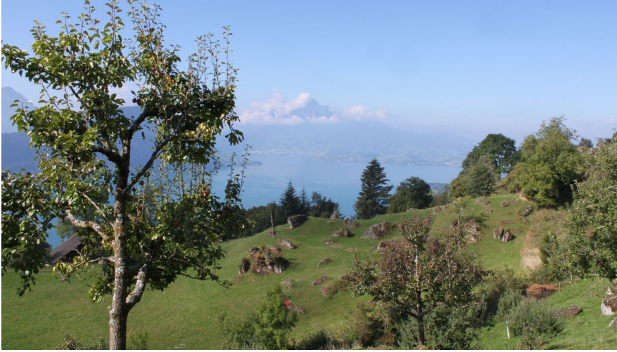
Aussicht auf den Pilatus von Santiberg, Weggis