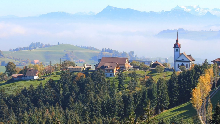
Das Dorf Menzberg