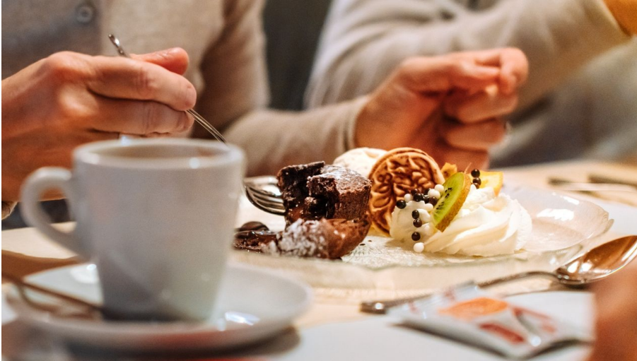
Feines Dessert im Berggasthaus Marbachegg