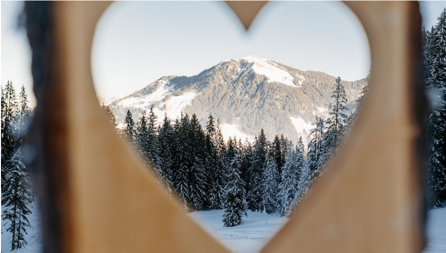
Fototrail Sörenberg - Winterrundwanderung Rossweid-Schwarzenegg-Rossweid - © Felder Photography, UNESCO Biosphäre Entlebuch