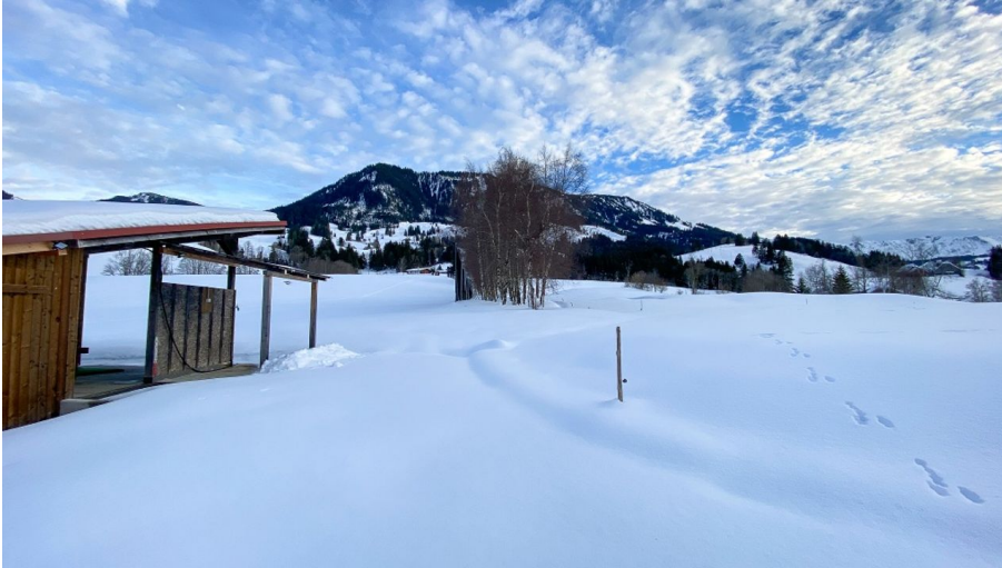
Golfplatz Flühli im Winter