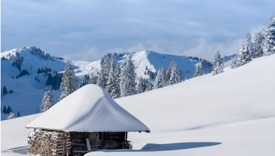
Fantastische Winterlandschaft rund um den Glaubenbielenpass in Sörenberg - © Roger Lustenberger / lustenberger-fotografie.ch, UNESCO Biosphäre Entlebuch