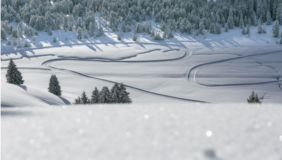
Panoramaloipen Salwideli Sörenberg