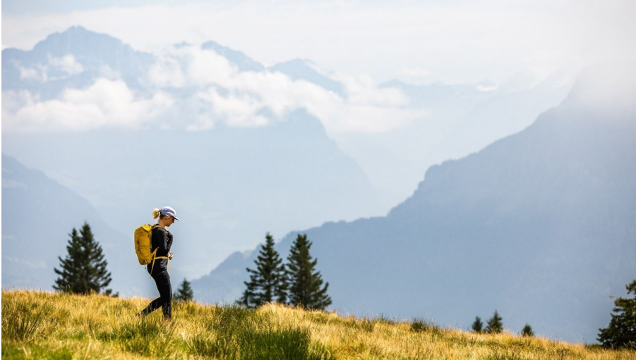
Wanderblondies, RIGI BAHNEN AG