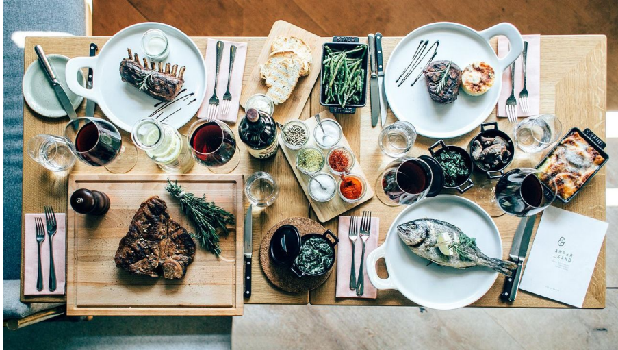
Ampersand Lucerne