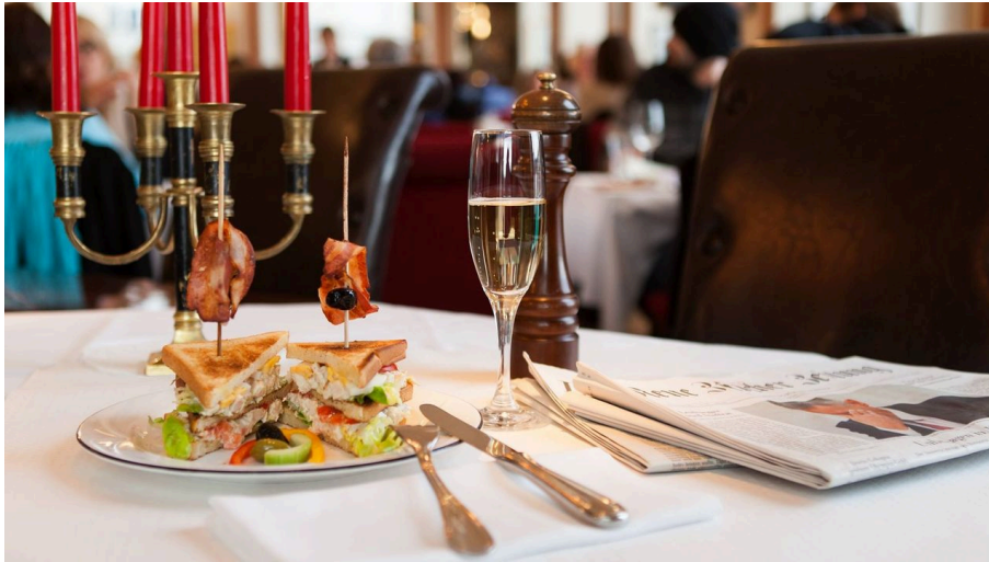
Café de Ville