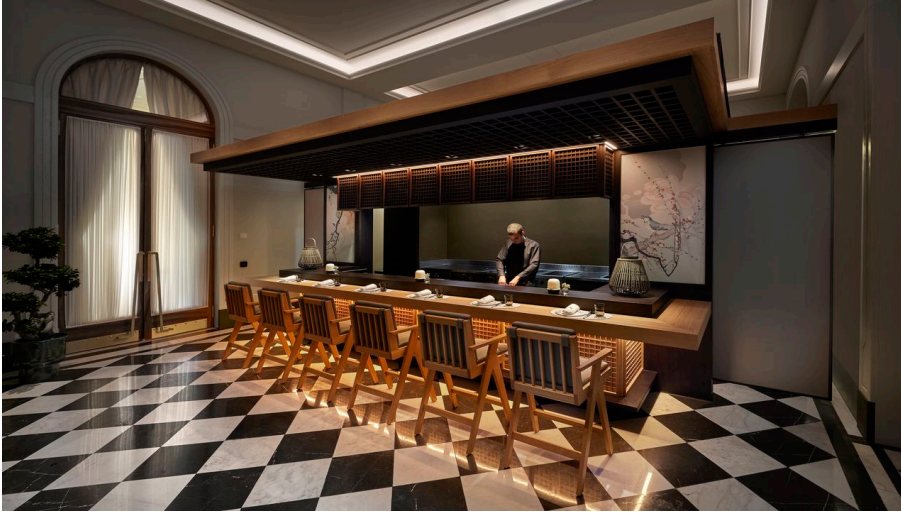
Mandarin Oriental Palace