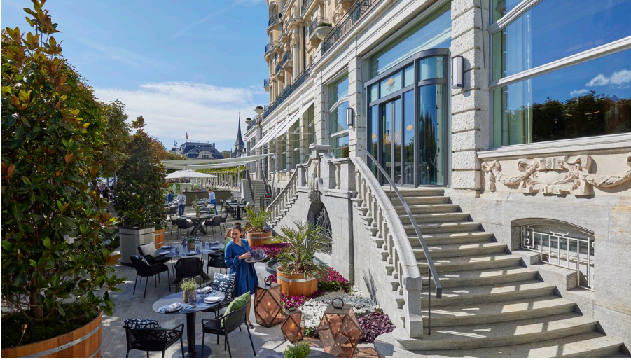
Quai 10