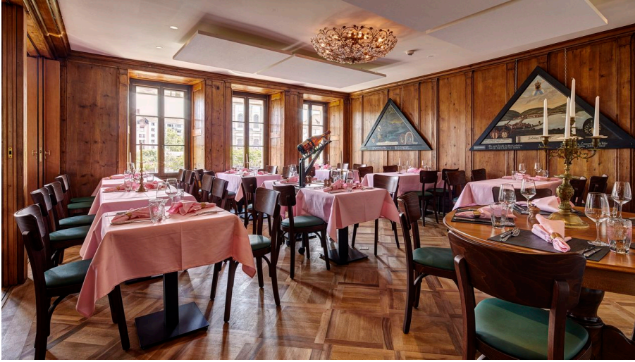
Luzern Tourismus, Gabriel Ammon / AURA