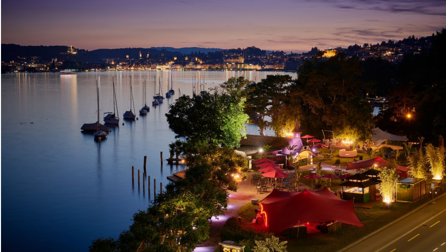
La vue du Sunset Bar Lucerne - © Jerry Gross | Hotel Seeburg Luzern