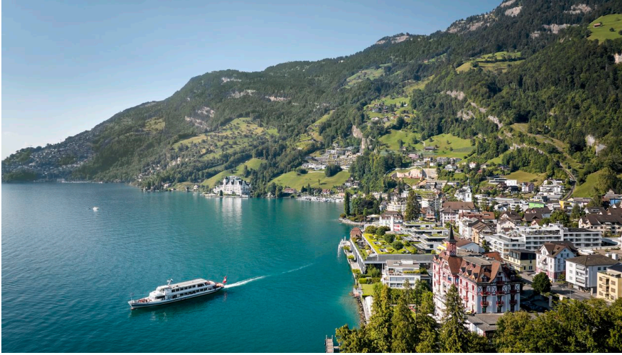
Chasse au trésor Riviera Vitznau