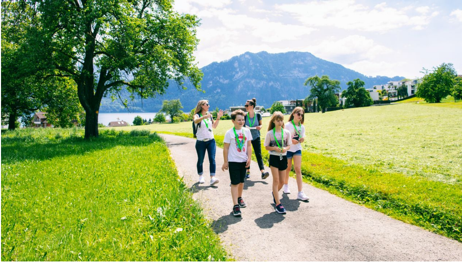
Foxtrail Helios Vitznau Weggis