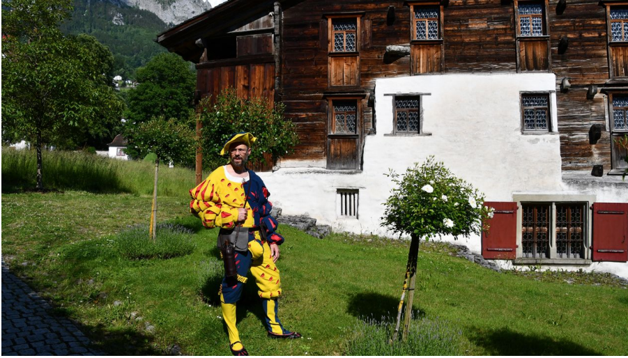
Visite scénique "En route avec..."