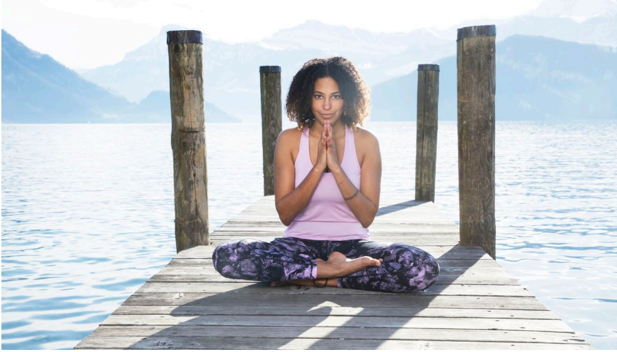
Yoga meets Weggis