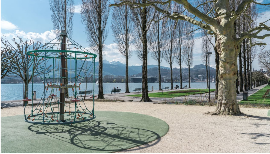
Laila Bosco, Luzern Tourismus AG