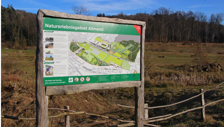
Aire de loisirs naturelle Allmend