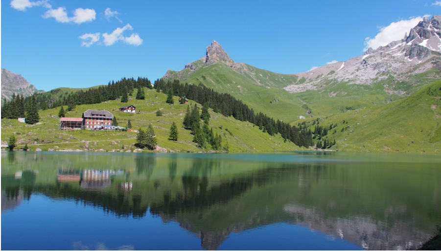
Auberge de montagne Bannalpsee_Wolfenschiessen_Nidwald