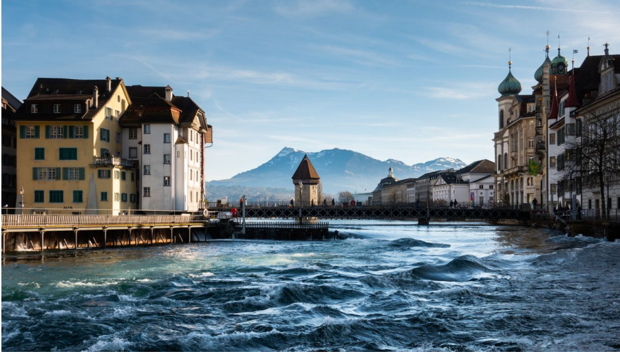
Le barrage à aiguilles Reusswehr