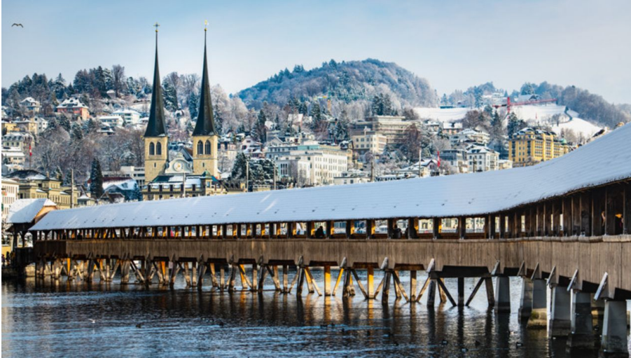
Collégiale Hofkirche