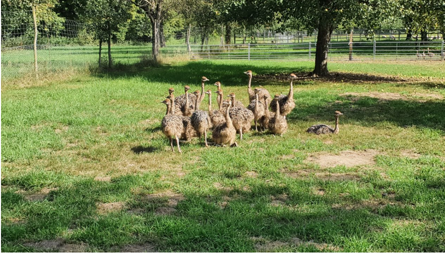
Straussenfarm Sempachersee_Yves Wagner und Markus Grüter