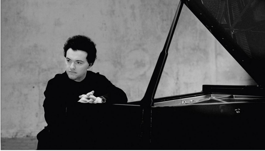
Festival de piano «Le piano symphonique»