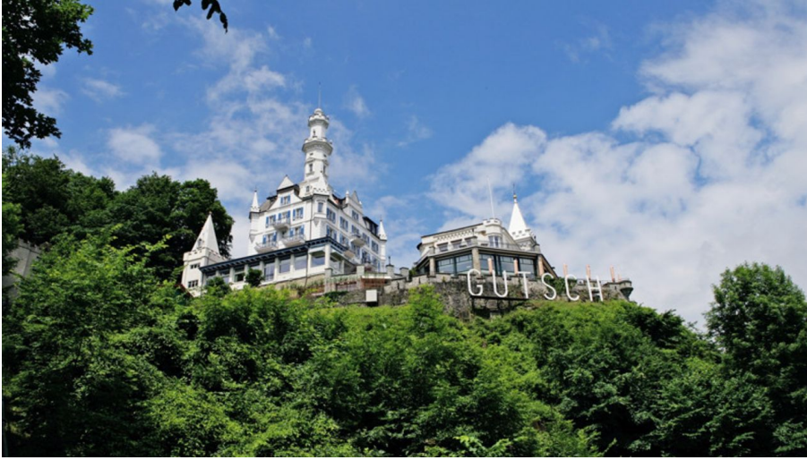
Château Gütsch