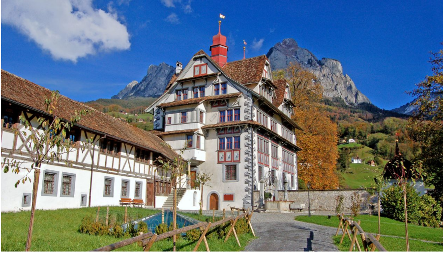
Stiftung Ital Reding-Haus, IG Wiege der Schweiz - info@wiegederschweiz.ch