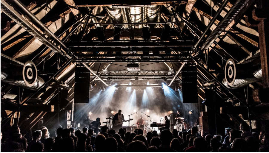
Concert live à la Schüür