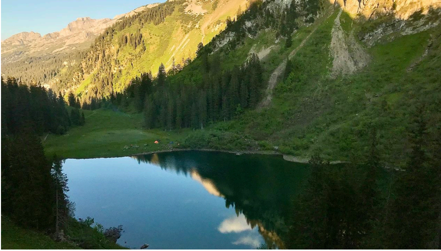
Luzern Tourismus, Gianluca Steffan