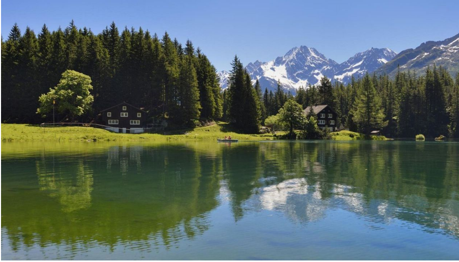
Arnisee à Intschi