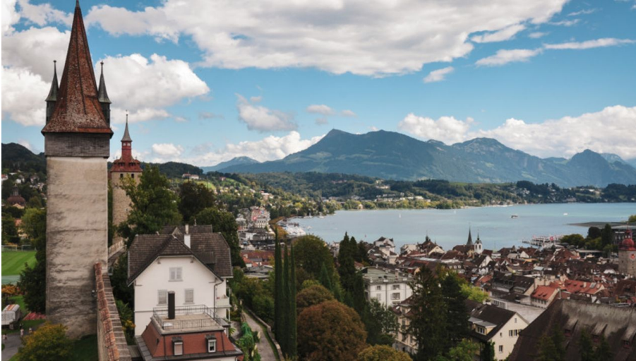
Les remparts de la Musegg