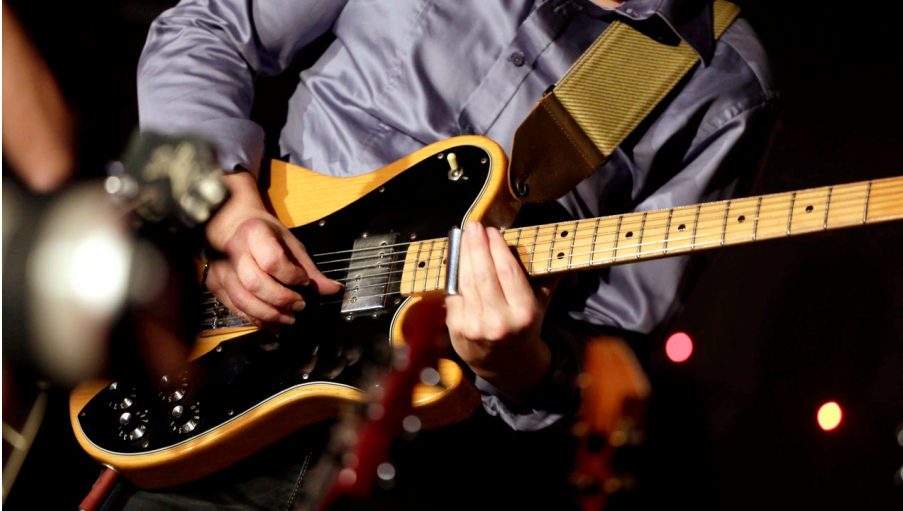
Lucerne Blues Festival