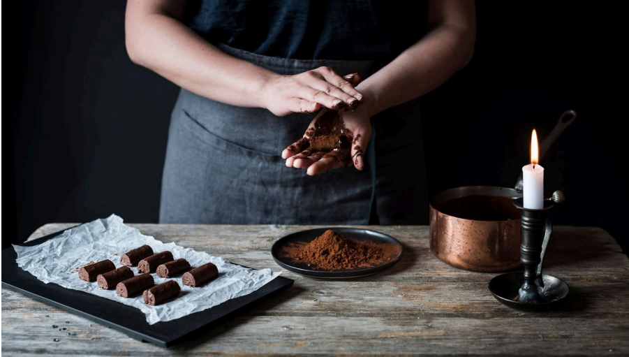
MaxChocolatier Création - © Max Chocolatier