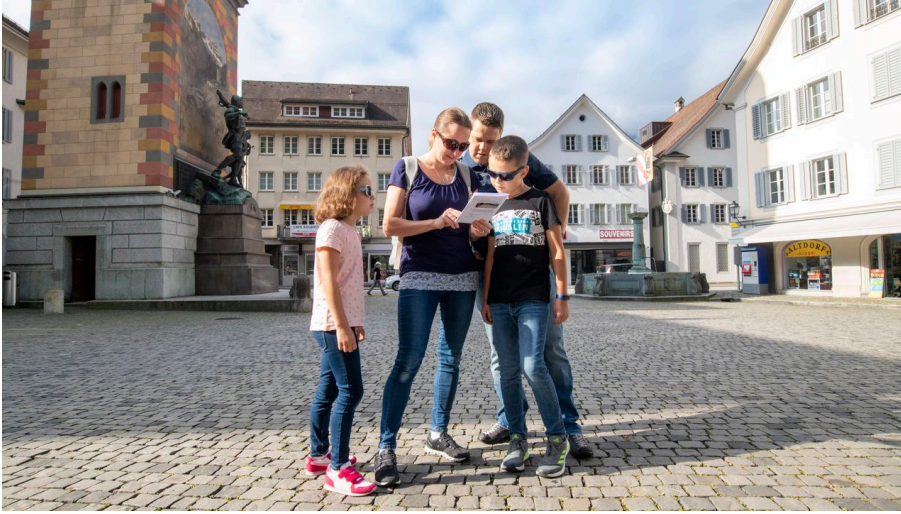
Où est Walterli - Chasse au trésor