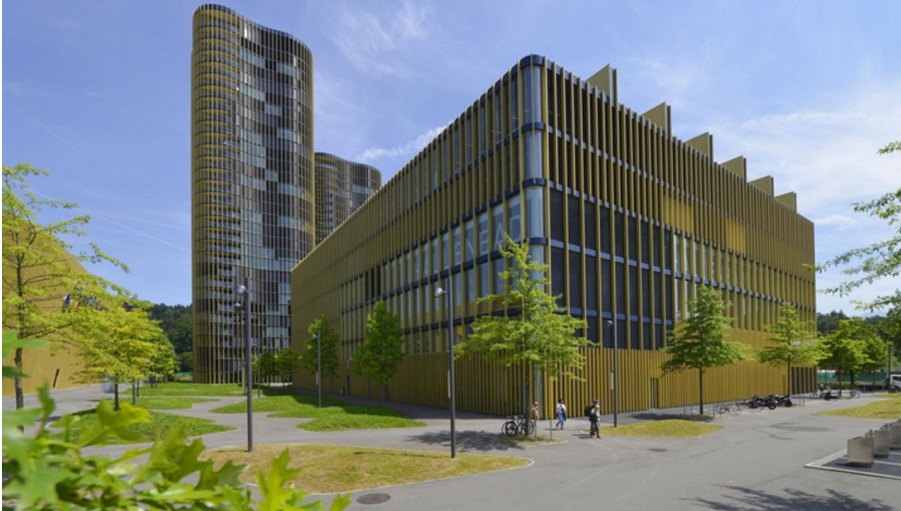
Allmend Piscine couverte