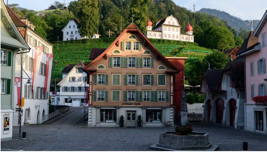
Samuel Büttler Photographie