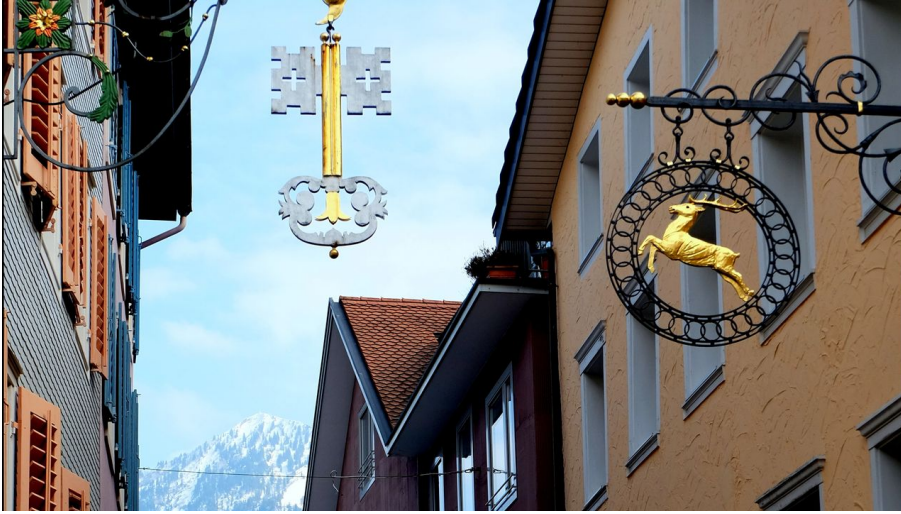
Rue de la Forge