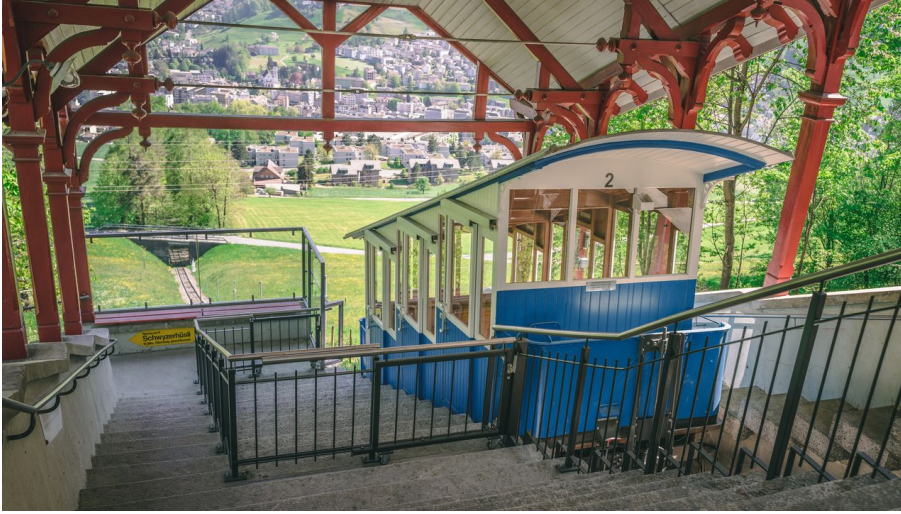
Sonnenberg Bahn