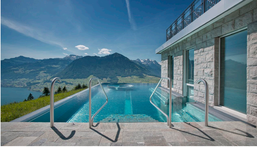
Piscine extérieure de l'hôtel Villa Honegg