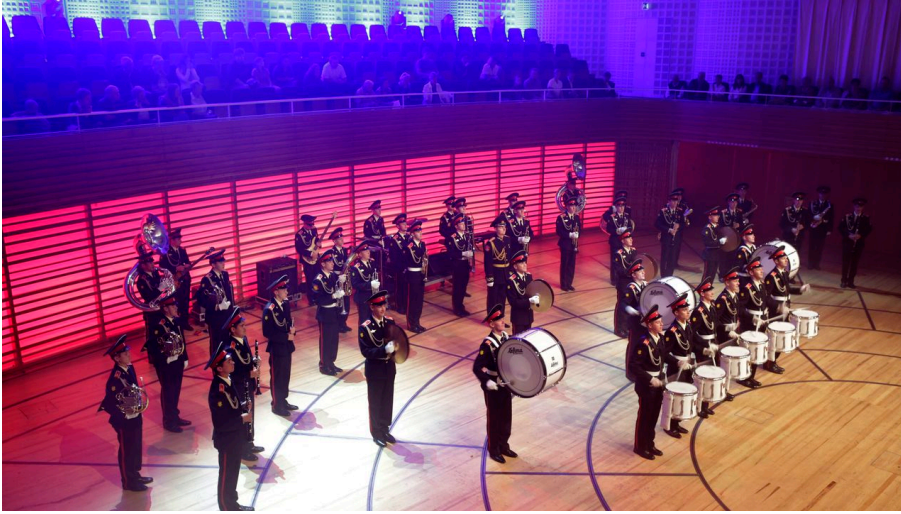
World Band Festival