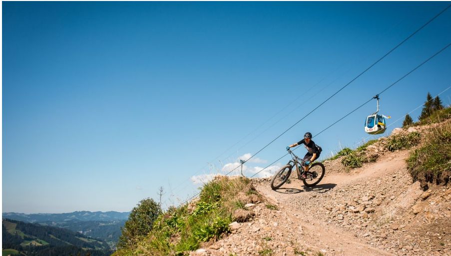
Saskia Dugon, UNESCO Biosphäre Entlebuch