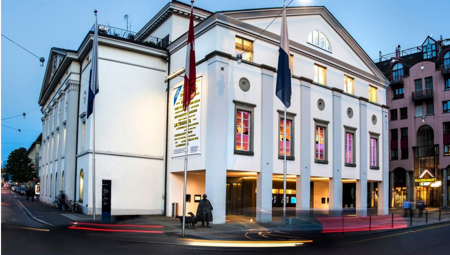
Luzern Tourismus AG, Region Luzern-Vierwaldstättersee