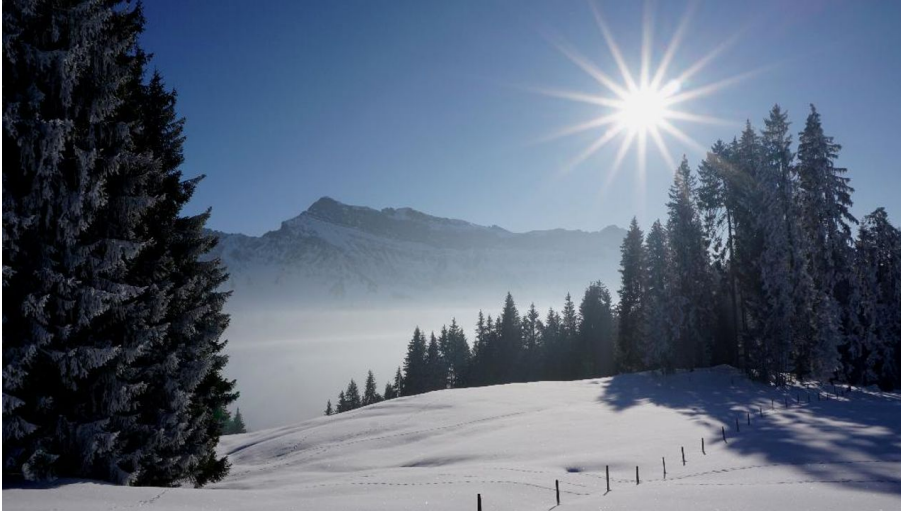
UNESCO Biosphäre Entlebuch