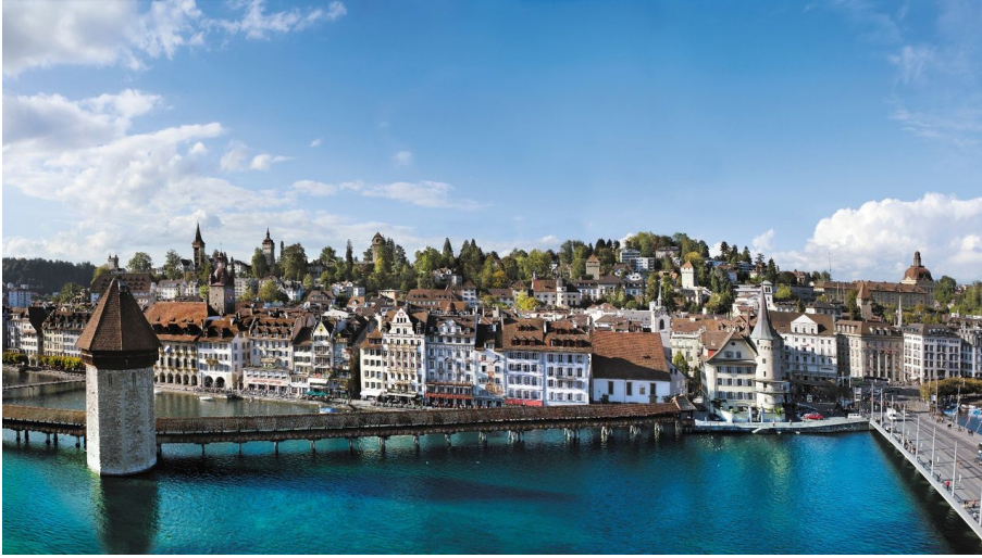
Private Selection Hotels & Tours, Private Selection Hotels