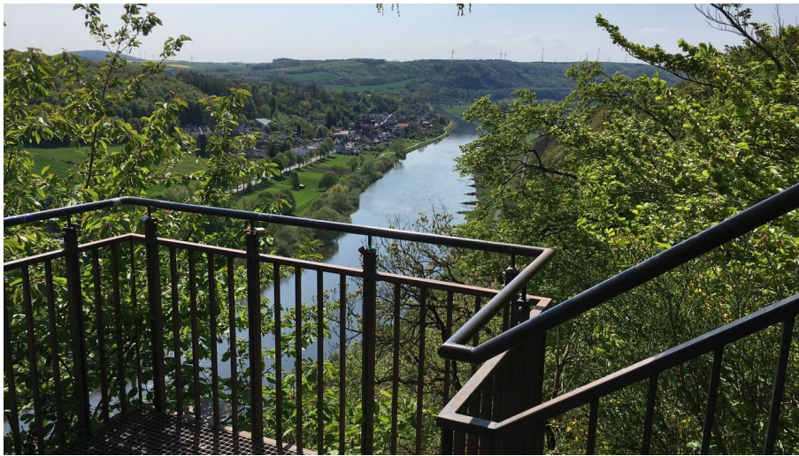
Weser-Skywalk Würgassen