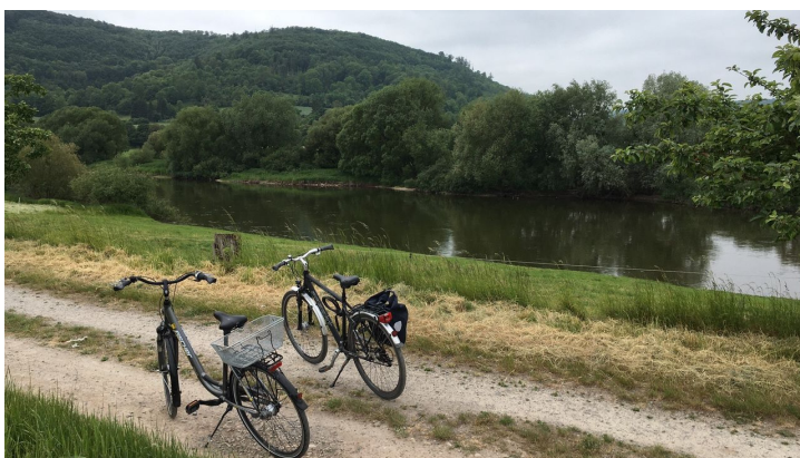
Radweg an der Weser bei Lauenförde - © Teutoburger Wald / Stadt Beverungen / J. Knipping