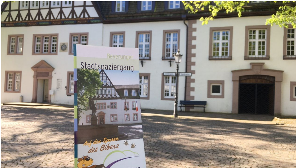
Beverunger Stadtpaziergang