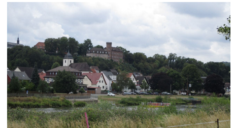
Blick auf Herstelle