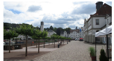
Hafen in Bad Karlshafen