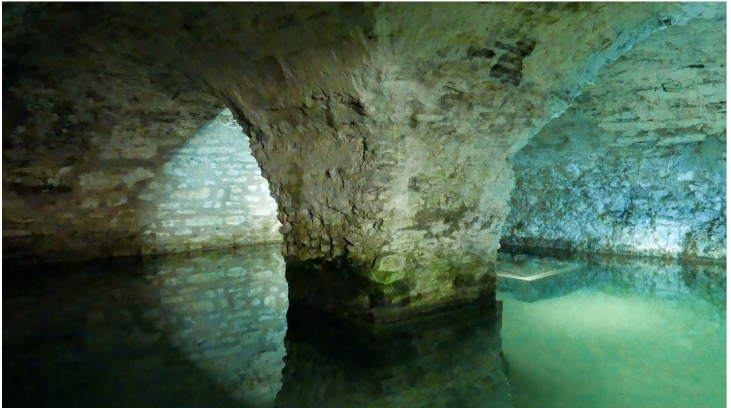
Quellkeller in der Kaiserpfalz

Am ersten Mittwoch im Monat ist das Museum bis 20 Uhr geöffnet.