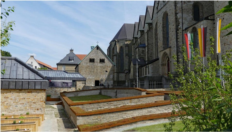
Kaiserpfalz mit Bartholomäuskapelle